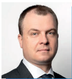
Шалаев Антон Павлович

Руководитель фракции «Новые люди» в Государственной Думе