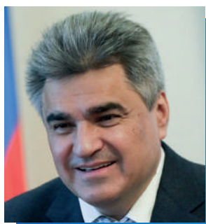
Нечаев Алексей Геннадьевич

Руководитель фракции «Новые люди» в Государственной Думе