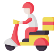
Доставка на дом